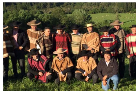
Campeón Nacional del Rodeo vigente asiste como consejero a esta Asamblea.